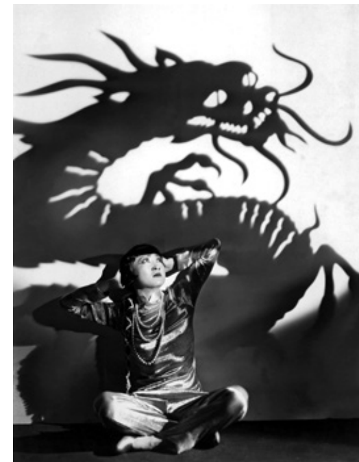
Daughter of the Dragon