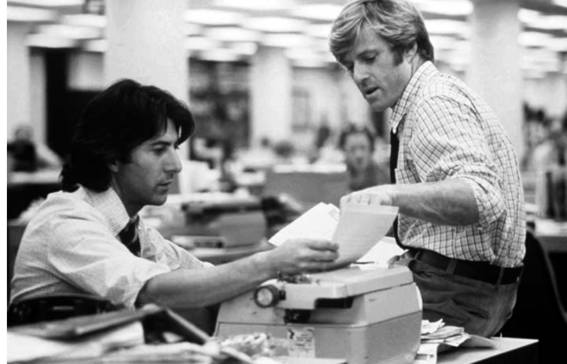
Dustin Hoffman und Robert Redford in All the President's Men

Da ist es einmal mehr, das Klischee vom Schauspieler, der so erfolgreich ist, dass er sich nur selbst im Weg stehen kann. Und ein Hollywood-Superstar war Robert Redford spätestens seit diesen beiden Filmen. Gut aussehend sowieso, ein Liebling aller, aber auch einer, der eine glückliche Hand bei der Auswahl seiner Filme hatte. Wie heisst es doch in The Way We Were (1973), einem