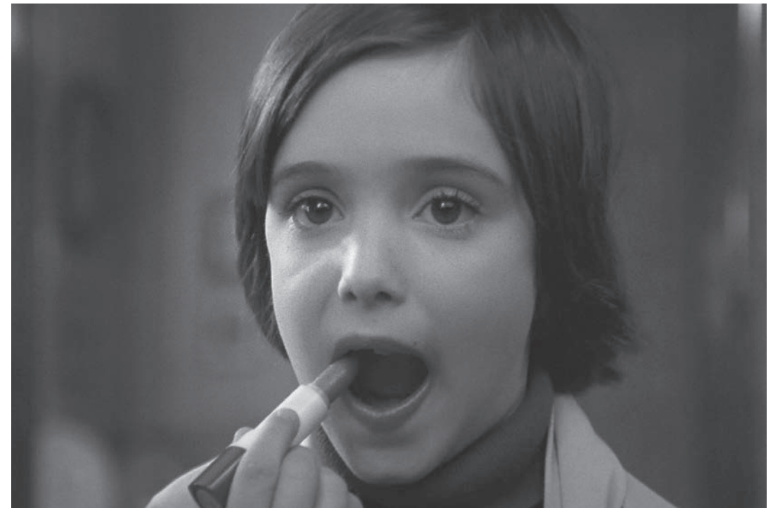
Ana Torrent in Cría cuervos (1976) von Carlos Saura

Wenn man jetzt noch René Cléments Jeux interdits dazunimmt, wird eines deutlich: Kinder sehen und erleben die Welt um sie herum ungefiltert, ohne Zynismus, ohne jede Beschönigung. Immer schon haben sie Unglücke und Schicksalsschläge überlebt, die kein so junger Mensch ertragen sollte. Oft hilft ihnen ihre ungebundene Vorstellungskraft dabei, um mit dem Ärgsten fertig zu werden. Auch die kleine Paulette,