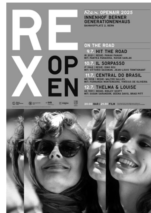
Plakat REX Openair 2025

Auf die Schaltung von eigenen Inseraten verzichten wir aus Budgetgründen weiterhin. Dank Gegenleistungen und Kooperationen sind wir dennoch in Publikationen und vermehrt auch im Onlinebereich von Festivals, Veranstalter:innen und Medien präsent: Solothurner Filmtage, Internationales Filmfestival Fribourg FIFF, Queersicht Filmfestival, Kunstmuseum Bern / Zentrum Paul Klee, Camerata Bern, Jazzwerkstatt Bern, Filmzeitschrift Filmbulletin und Berner Kulturagenda.